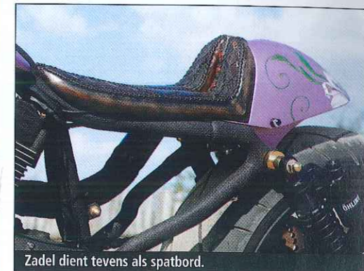
Zadel dient tevens als spatbord.