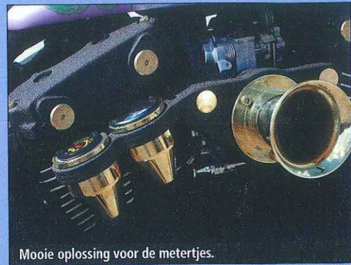
Mooie oplossing voor de metertjes.