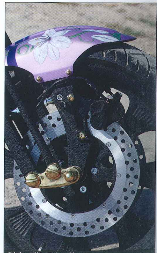
Enkele schijf RevTech remklauw.