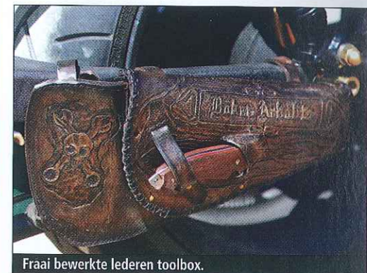
Fraai bewerkte lederen toolbox.