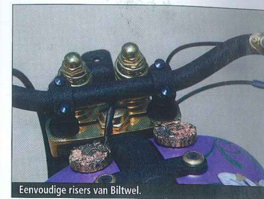
Eenvoudige risers van Biltwell.