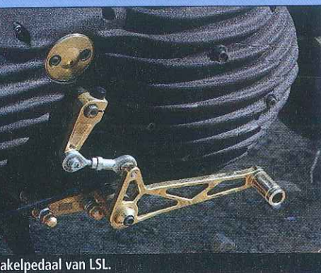
voetpedaal van LSL.