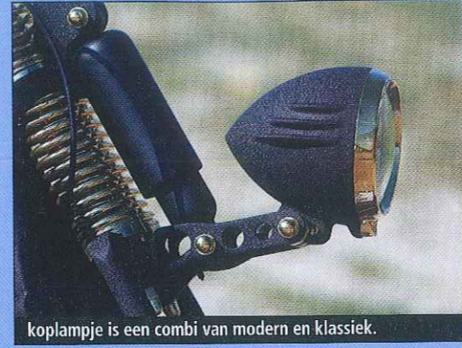
koplampje is een combi van modern en klassiek.