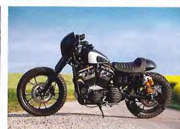
Amortisseurs Öhlins, deux-en-un BSL Bomb et cul de selle Burly Brand, de quoi réinterpréter le cafe racer du 21 ème siècle.

C ent bornes d'autonomie à peine, mais une partie cycle revue et corrigée qui permet de parcourir ce trajet hors des sentiers battus, voilà qui résume l'état d'esprit de ce Custom Crawler, dont la base est un modeste 883